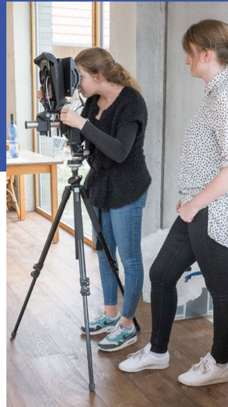
Architekturaufnahmen on location

Deutsch, Fach- und Wirtschaftsenglisch sowie Wirtschafts- und Sozialkunde vervollständigen das Fächerangebot.