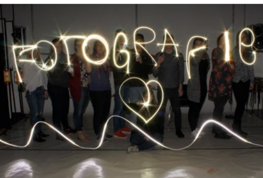
Vielfältige Arbeitsbereiche und praxisbezogene Ausbildung